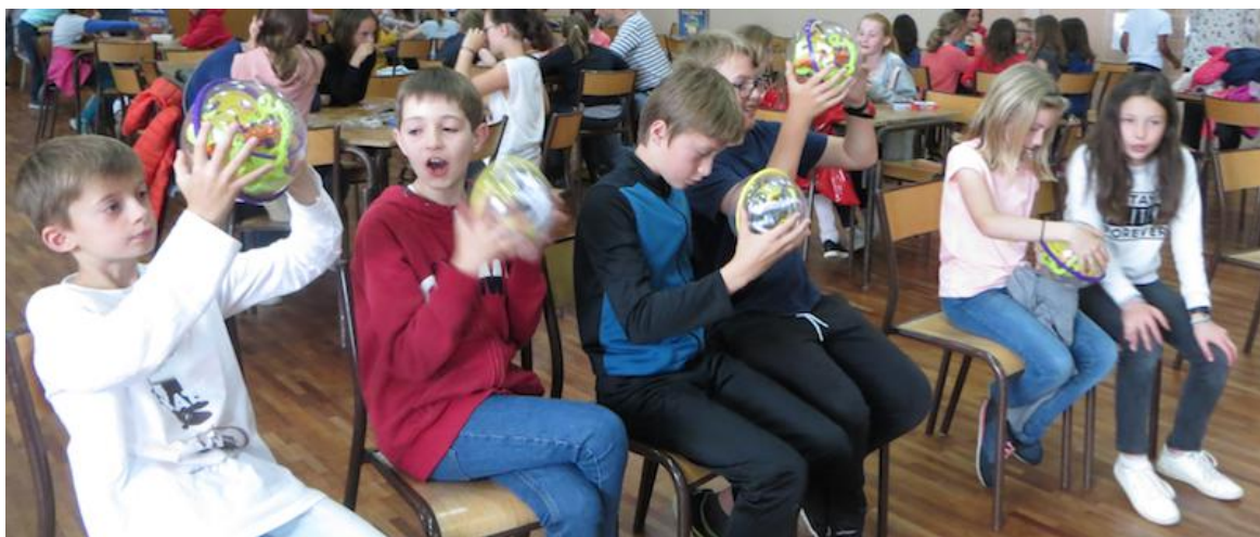
1 er juin 2018 - Salle des Fêtes des Roches-Prémarie - Séance collective de Perplexus