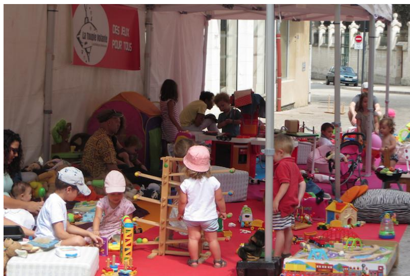
14 juillet 2018 - Square de Magenta - Poitiers - une chambre d'enfant XXL

13 particuliers : 11 adhérents ont loué des jeux ou fait appel à La Toupie Volante pour des animations, une adhérente a fabriqué des jouets et une personne a adhéré par soutien.